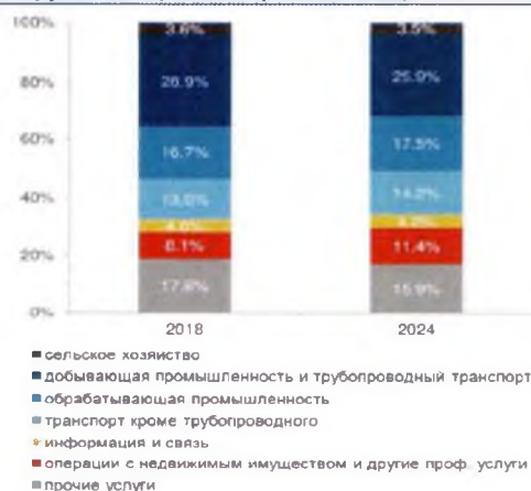
Рис. 2. Структура инвестиций в основной капитал (по крупным и средним организациям)